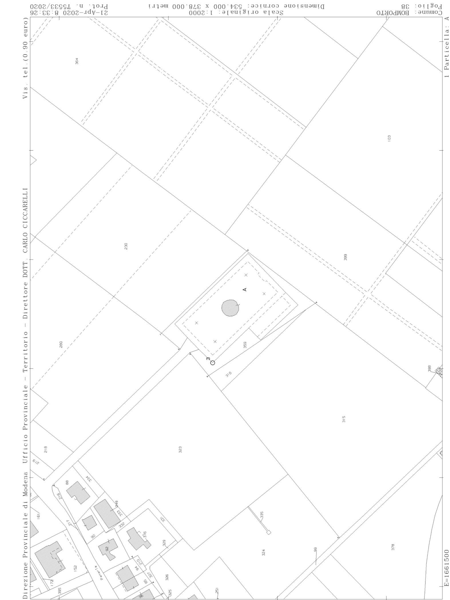
CATASTO - ESTRATTO DI MAPPA scala 1:2000